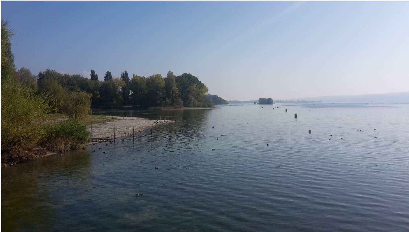
Die kleine Liebesinsel rechts von der Halbinsel Mettnau bei Radolfzell.