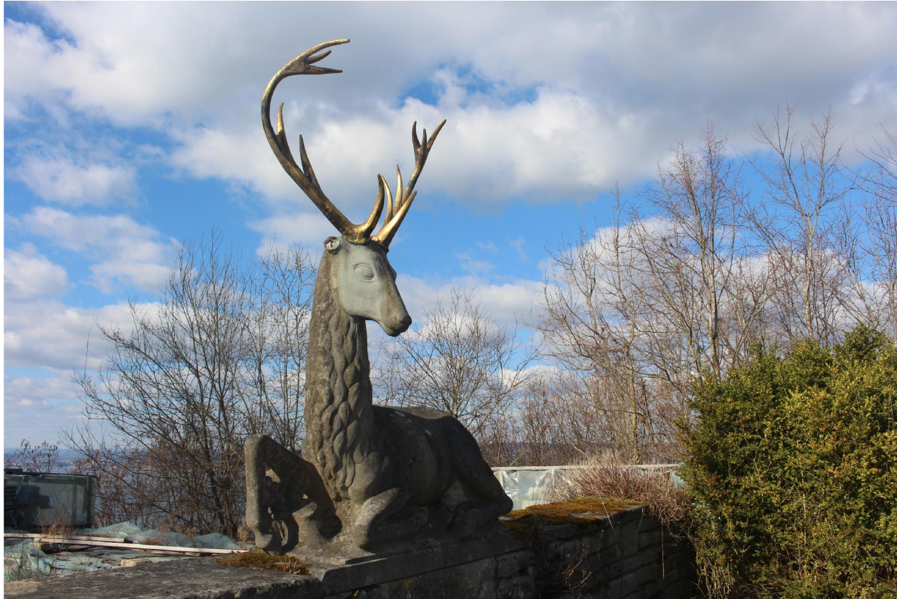
Hirsch aus Sandstein im ehemaligen Schlosspark Sandegg.