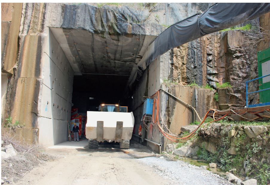
Eingang zum Steinbruch Leholz.

Heute nicht mehr genutzte Steinbrüche sind wichtige Naturparks für Menschen, Tiere und Pflanzen. Diese Orte leisten einen wichtigen Beitrag zur Erhöhung der Biodiversität.