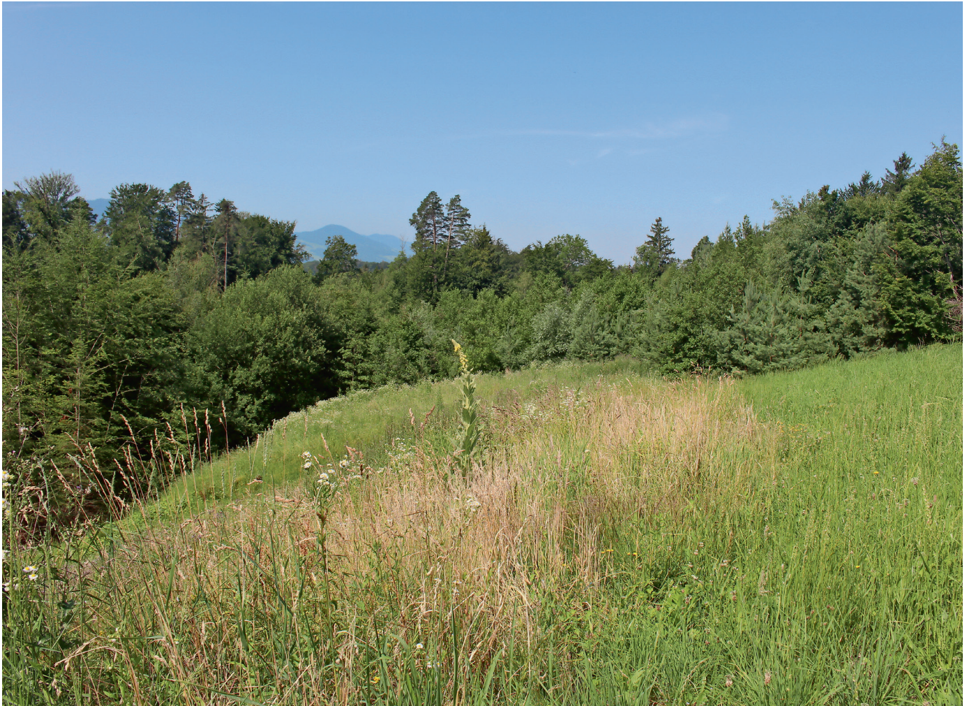
Renaturiertes Terrain des Steinbruchs Brand.