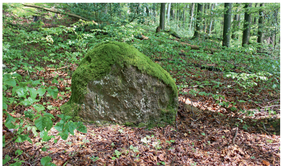
Sandstein-Menhir im Gasterholz bei Maseltrangen (SG).

Bereits in vorrömischer Zeit errichteten unsere Vorfahren im Gasterholz bei Maseltrangen (SG) einen Menhir aus Sandstein. Die Römer nutzten den einheimischen Sandstein, zum Beispiel für den Hypokaust (römische Bodenhei-