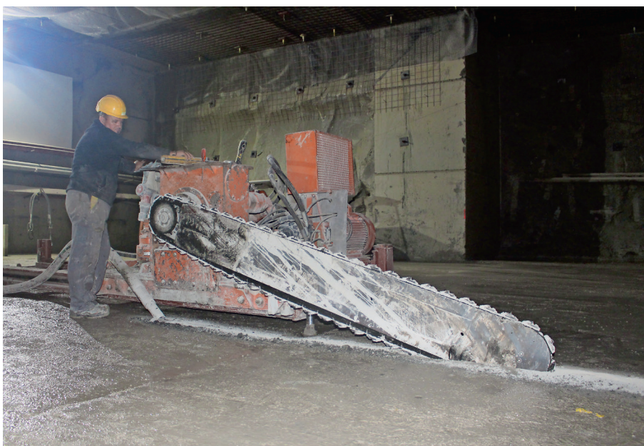
Die Diamantschwertsäge schrämt (sägt) im Steinbruch Leholz vertikale Schnitte in die Gesteinschicht.