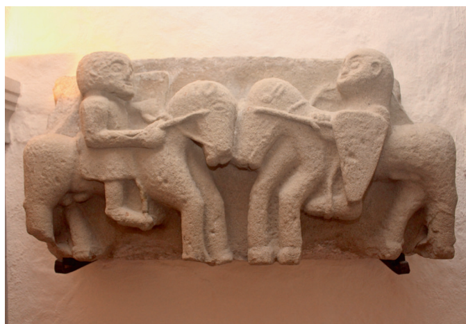
Sandstein-Relief «Zwei kämpfende Ritter» aus dem 12. Jh.