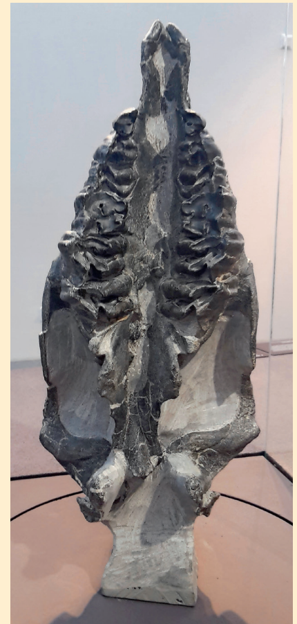
Präparierter Nashornschädel.

Fossilien werden im Sandstein selten gefunden. Umso grösser war die Überraschung, als ein Steinmetz des Müller Natursteinwerks den Schädel eines urzeitlichen Nashorns in einem Sandsteinblock fand. Der Jahrhundertfund ist circa 22 Millionen Jahre alt und kann heute im Naturmuseum St. Gallen bewundert werden.